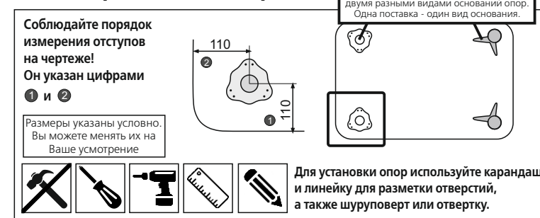
Схема крепления опор D50 с прив. фланцем