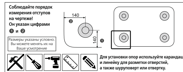
Схема крепления опор Лофт