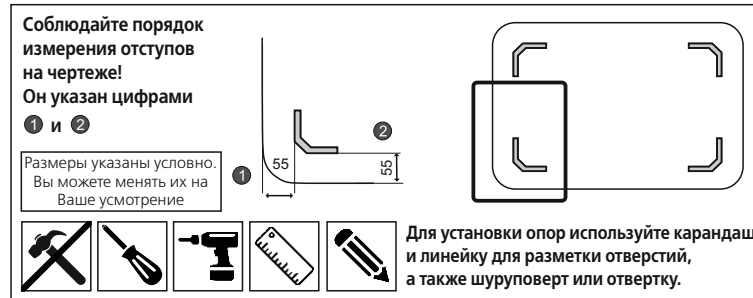
Схема крепления опор Дуга