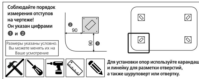
Схема крепления опор ДГ1